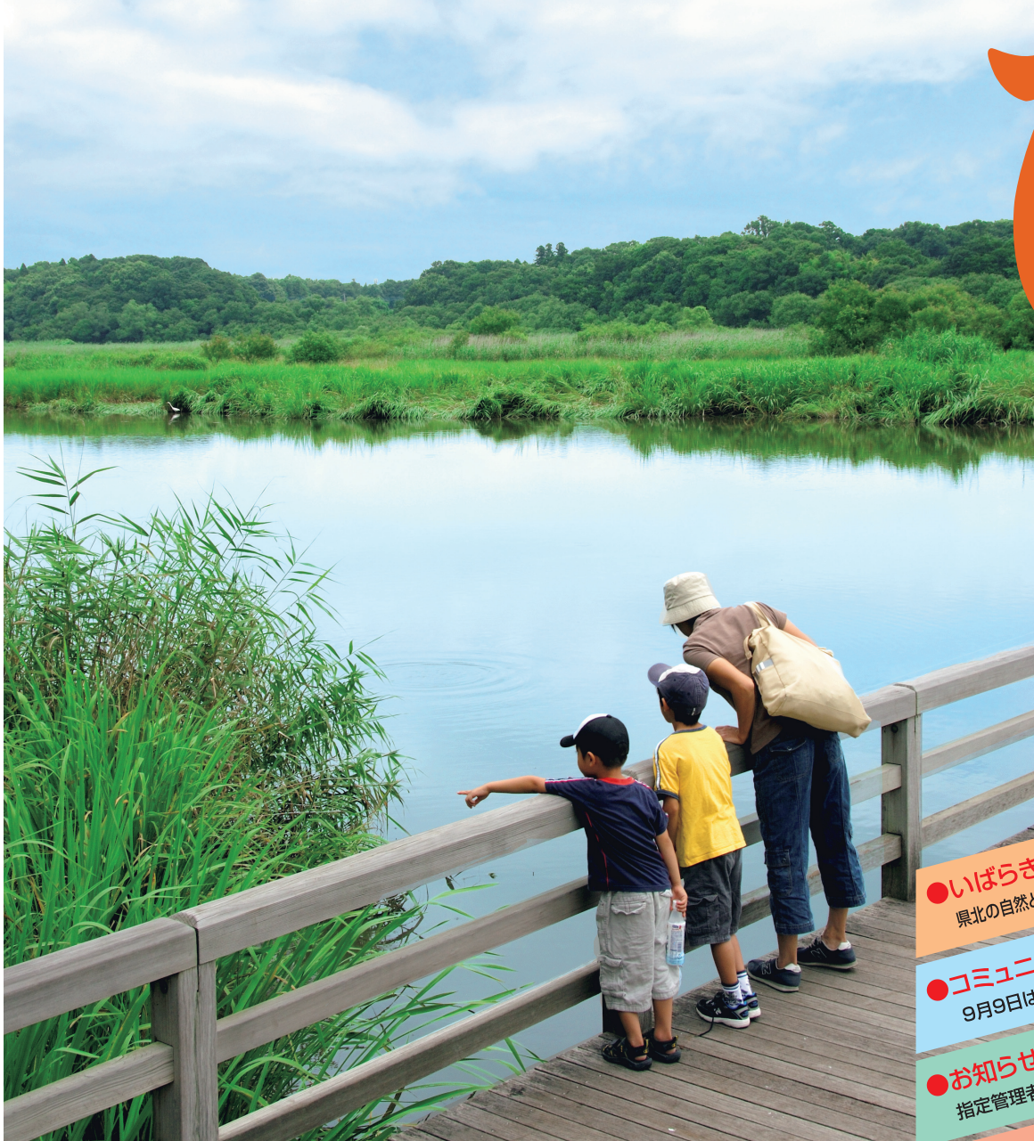
ふれあい橋から見た菅生沼 (坂東市)

9月号 平成20年9月1日 発行人 茨城県広報広聴課 〒310-8555 水戸市笠原町978番6 TEL 029-301-2128 FAX 029-301-2168 TEL 029-301-1111(代表)