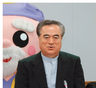
茨城県知事 橋本 昌