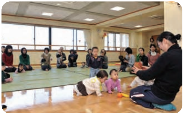
保育士を中心に親子の交流を深め合う

ム」を併設しています。ここでは、平日の育児相談や曜日ごとに対象年齢を分けた育児講座、年数回の地域への出前保育などが行われています。 取材当日は〇歳〜一歳半のクラスが開かれていて、十五組の親子が参加されていました。保育士の指導の下、皆で輪になつて赤ちゃんマッサージをしたり歌ったりと、笑いの絶えない空間になっていました。 参加されている方は、「同じくらいの子を持つお母さん友達ができてよかった」「他の子と競うように立ったり踊ったりするようになった」と話されていました。 このような親子の交流や育児相談などができる地域子育て支援拠点は県内に約一七〇カ所あり、その保育園に通っていないなくても利用でき、自由な時間を過ごすこともできるそうなので、親子の交流の場として周知