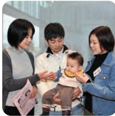
子守唄を通じ、親子のきずなを深めましょう

技能五輪・アビリンピックいばらき大会2009 推進協議会事務局 ☎029(301)3660 〓3669 http://www.pref.ibaraki.jp/ginougorin-abilympic/