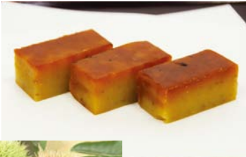
(いわまの栗菓子「ぎゅ」)