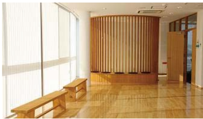
公共施設の内装の木質化