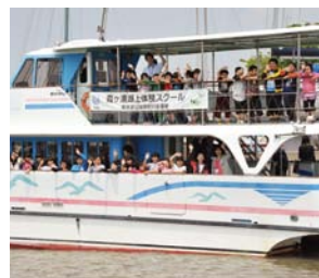
霞ヶ浦湖上体験スクール