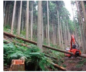
高性能林業機械を使った間伐作業