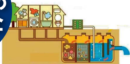
高度処理型浄化槽の仕組み