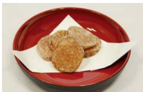
(お歳暮ギフトとなった芋なっとう) ※これの規格外品がギフトに。

A特定のマッチング会ではなく、多くのマッチング会に参加することにより、販路拡大につながっています。マッチング会で担当の方に何度も会うことで、百貨店のお歳暮ギフトに当社の製品が採用されました。