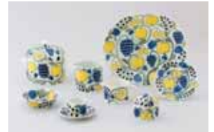
ビルガーカイピアイン「パラディシ」 1969-1973年、1988年、2000年- 岐阜県現代陶芸美術館蔵

1873年創業のアラビア窯は北歐を代表する陶磁器メーカーであり、良質な日用食器は世界中で愛されてきました。アラビア窯の初期から現在の製品まで約80件を展示し、その歴史を紹介します。