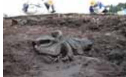
つくば市上境旭台貝塚の土偶

茨城県教育財団が平成23年度に調査した遺跡を中心に、その発掘成果や当時の様子を分かりやすく紹介します。