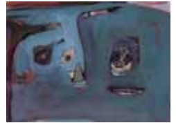
「開かれた顔 90-2」1990年 水彩、ペン 個人蔵

潮来市出身の堀井英男(1934-1994)の初となる大回顧展。高く評価された色彩銅版画と、ほぼ未発表の水彩画により、独特の世界を築き上げた現代作家の全貌を紹介します。