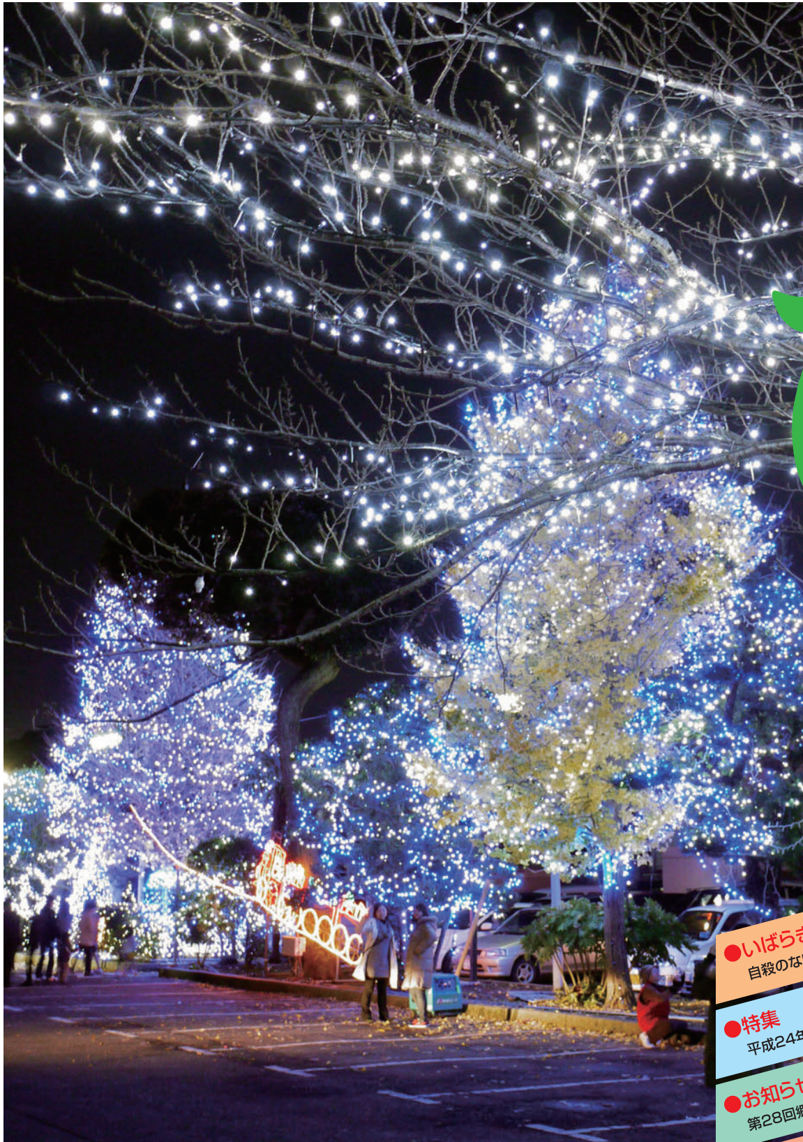
イルミネーションフェスティバル2012(12月1日~31日、行方市麻生公民館ほか) 行方市商工会 ☎0299(72)0520