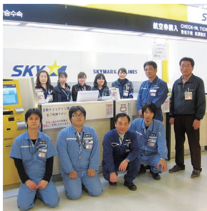
スカイマーク(株)茨城空港所の皆さん

航2周年を迎えるスカイマークを、引き続き県民の皆さまにご愛顧いただき、スカイマークのリーズナブルな運賃で、空の旅をお楽しみください。 茨城空港が、海外のシンクタンクである航空情報センターから、LCC(格安航空会社) 受け入れのために先進的な取り組みを行っている空港を表彰する「ローコストエアポート・オブ・ザ・イヤー2011」を受賞しました。 この受賞は、LCCの台頭にいち早く着目してボーディングブリッジを廃止し、ターミナルビルをコンパクトにするなど、運航コスト抑制のためのさまざまな取り組みが評価されたものです。今後も、LCCを始めとした航空路線の拡充に取り組んでまいります。