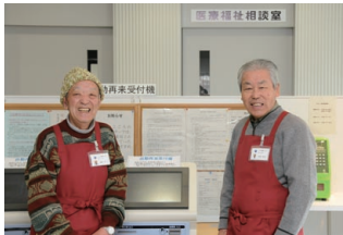
私たちがご案内します

「笑顔で親切にしてください、安心して受診できました」と患者さんや家族の皆さんは、うれしそうに話をしてくれました。