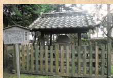
齊昭の自筆の文字が刻まれた 種梅記碑・弘道館

梅香る街として知られる県都水戸。水戸の梅の歴史は古く、梅里先生と呼ばれた水戸藩第2代藩主徳川光圀にさかのぼります。また第9代藩主斉昭の書いた「種梅記」には、梅の花は春に先んじて咲くことから、水戸藩が天下の先駆けとならんことを願うとともに、梅干は保存食として大変有効であることから、偕楽園や弘道館、水戸藩領内に梅を植えさせたとあります。