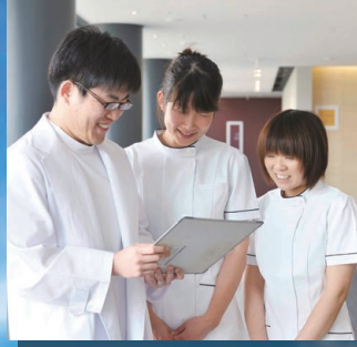
熱心な医療スタッフ