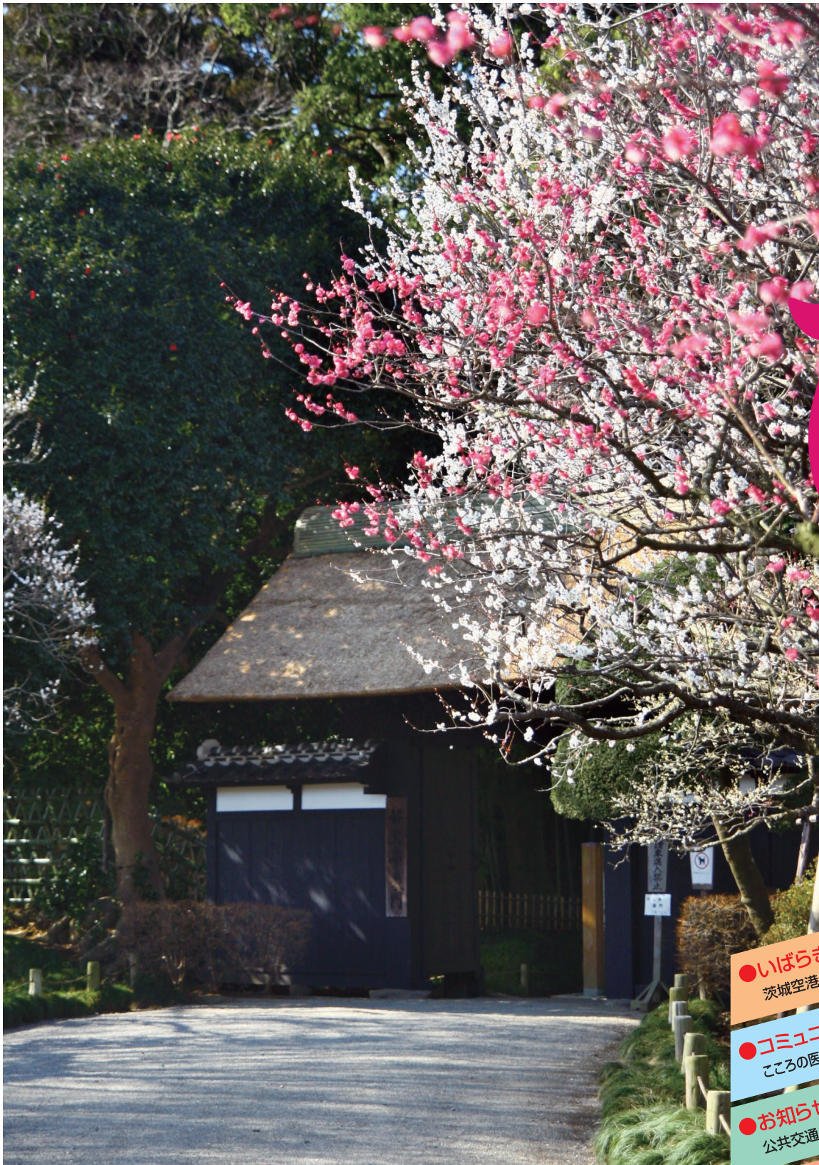
水戸の梅まつり(2月18日~3月31日、偕楽園 表門)