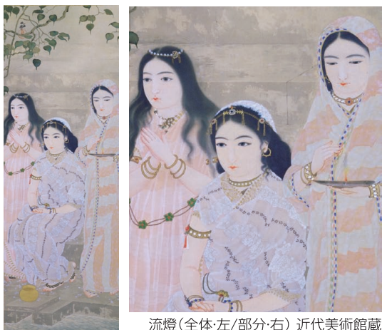
流燈(全体・左/部分・右) 近代美術館蔵

県近代美術館・天心記念五浦美術館では、季節に合わせて作品を展示しています。ぜひお越しいただき大観の魅力に触れてみてください。