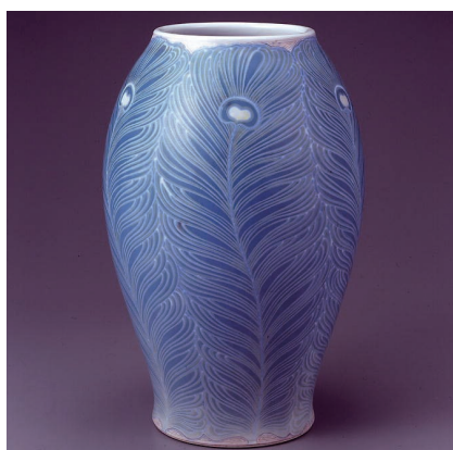
葆光彩磁孔雀尾文様花瓶 大正3年頃(c.1914) 県陶芸美術館蔵