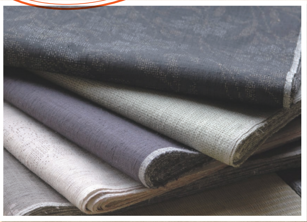
本場結城紬。色、柄ともに様々なデザインのものがある。