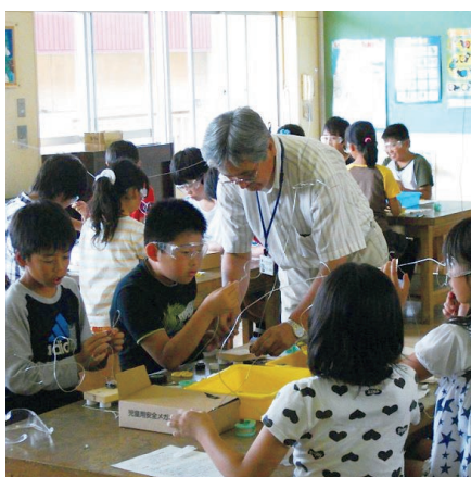
理科専門員と一緒に学ぶ鉢形小の児童

自然や科学の不思議さや面白さを体験し、科学への興味・関心を高める「サイエンスキッズおもしろ理科教室」は、今年度県内の300の小