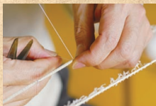
伝統の技である「糸つむぎ」 かつろ 「拵くり」「地機織り」の3工程が、昭和31年に国の無形文化財に指定された。写真は「拵くり」。

11月3日は文化の日。日本の着物は、世界に誇れる文化です。本県の結城紬は、古くから知られ、江戸時代の「和漢三才絵図」に紬の最上級品は結城のものと紹介されています。