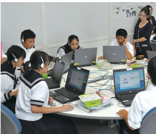
東海南中学校での発音力ソフトによる英語授業

小学校で身に付けた英語の音声認識の力を基礎として、中学校では、モデル校99校に「発音力」ソフトを導入して、正しい発音ができるように指導します。正しい発音を学習す