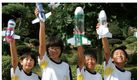
自信作の水ロケットを掲げる騰波ノ江小の児童

ドから勢いよく飛び立つたびに大きな歓声があがりました。実験を繰り返す中で、水と空気の量により飛行距離に違いが生じるこ