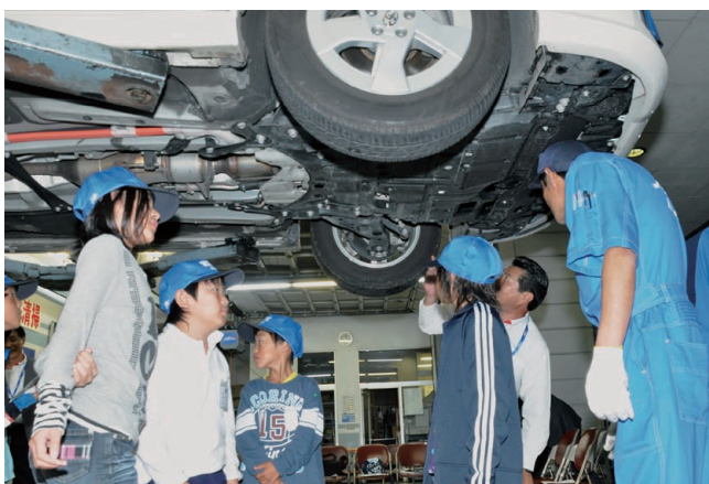
企業における職場見学(ネットトヨタ茨城)

この機会に、ぜひ本制度に積極的に登録いただき、学校教育活動や地域・社会教育活動などに皆さんの力を貸して下さるようお願いいたします。 ※登録いただいた事業所などには登録証を交付します。 ※特徴ある取り組み内容を県HPなどで広く県民に紹介します。