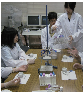
大学では高度な内容の実験にも取り組みます

設けています。来年度には、アメリカの大学や研究施設を訪問する海外体験学習も予定されています。