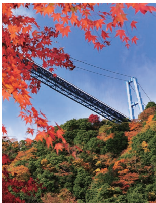
竜神大吊橋(常陸太田市)