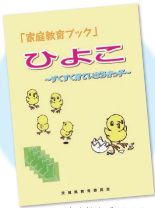
家庭教育ブックひよこ

県では、平成二十年度から、家庭教育支援資料として「家庭教育ブック」を作成し、就学前の子どもを持つ保護者に配布しています。今年度はさらに対象年齢を幼児期に下げた、「家庭教育ブックひよこ」を作成し、三歳児をもつ保護者、幼稚園、保育所などに配布する予定です。子どもの発達や食事、生活リズムなど、子育てに必要な知識が満載で、分かりやすい内容になります。子育てに悩んだり、困ったりしたときの強い味方になることでしょう。