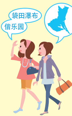
(龍ヶ崎市男性:三十代)

また、現在、大洗アウトレット、アクアワールド大洗水族館などを含むツアーの募集が行われています。