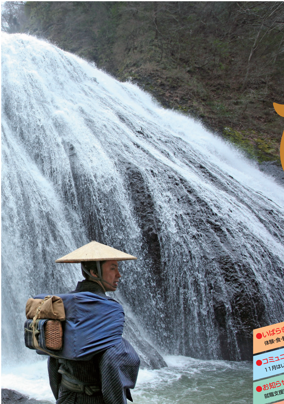
袋田の滝(映画『桜田門外ノ変』ロケシーン)