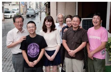
目指すは温故知新のまちづくり

さらなる活性化を目指して考え出された「くろばね朝市『世界の屋台村』」は、「くろばね朝市」に「国際性」という新しいテーマを盛り込んだプランです。