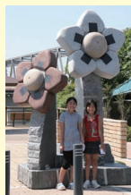
会場の観水公園での1コマおむすびの花と記念撮影

問 常総市都市整備課 ☎0297(30)6202 ✉toshiseibi@city.joso.lg.jp マ まちなか展覧会ホームページ http://www.matinaka.com