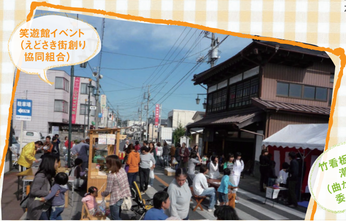
笑遊館イベント (えどさき街創り 協同組合)

自分たちのまちを自分たちの創意工夫で活性化しようと、積極的に取り組んでいる商店街があります。商店街活性化コンペ事業で受賞された、3つの「がんばる商店街」を訪ねてレポートします。