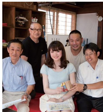
街の情報発信基地「えどさき笑遊館」

同じく優秀賞の稲敷市のえどさき街創り協同組合は、地域の伝統である三社巡りを活用した活性化に力を入れています。寺社の通りに空き店舗を活用したたまり場や市を設け、まちの人びとが普段から気軽に交流する場を創出。また、「節分の豆まき廻り」や「ひなまつり」、「演芸バトル」など、年間を通してさまざまなイベントを開催し、地元以外の人びとも訪れています。イベント来場者にお汁粉をふるまうサービスも人気です。