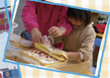
くろばね朝市 (くろばね商店会)