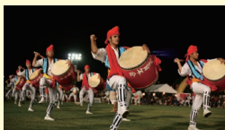
エイサー(沖縄県沖縄市/園田青年会)

郷土民俗芸能の祭典では全国にも類を見ない規模の野外大ステージで、全国各地の本物の郷土芸能と若さあふれる青少年の演技の競演を堪能できる日立市の秋の一大風物詩です。