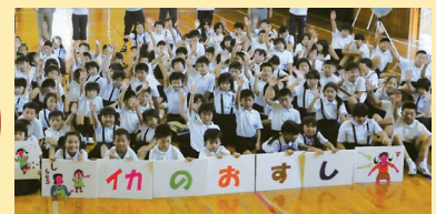
防犯教室の様子(水戸市立飯富小学校)

☎ 県生活文化課 安全なまちづくり推進室 ☎029(301)2843 ㊟029(301)2848