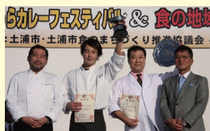
第6回土浦カレーフェスティバル、土浦C-1グランプリ表彰式

第7回を迎える「土浦カレーフェスティバル」は、「土浦咖喱物語」認定店をはじめ、土浦市内外の飲食店や高校生が地元の食材を活かし考案したカレー料理や、県内外の食の名産品が大集合します。さらに、土浦カレー王者を決める「土浦C-1グランプリ」をはじめ、盛りだくさんの内容で皆さまをお待ちしています。ぜひご来場いただき、ご自身のカレー王者を見つけてください。