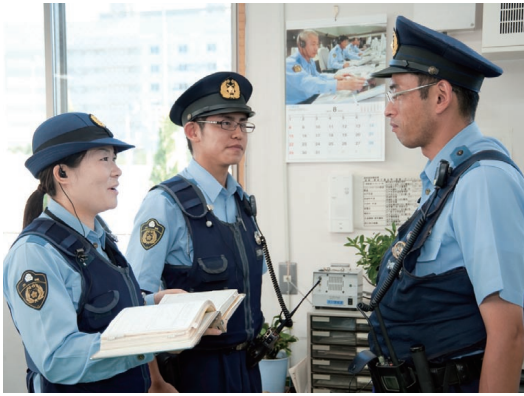
交番内での業務報告