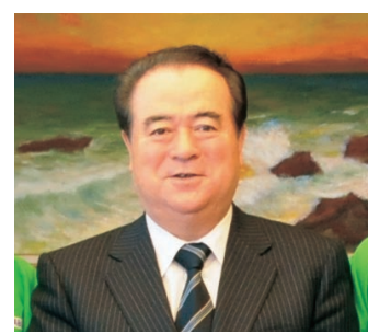
茨城県知事 橋本 昌