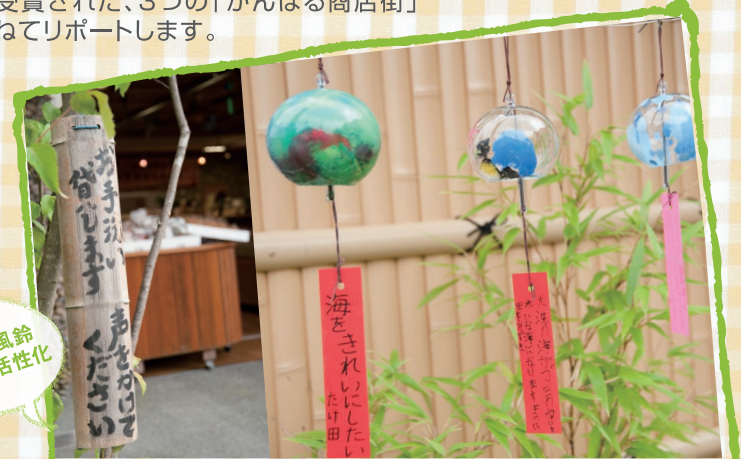
竹看板& 潮風の風鈴 (曲がり松活性化 委員会)

この事業を活用した多くの商店街で、来訪者数の増加や気運の盛り上がりなどの成果があったそうです。今年度も、数多くの団体が参加し、最優秀プラン一事業、優秀プラン七事業が選定されました。どのプランにも、地域ならではの趣向を凝らした斬新なアイデアが盛り込まれており、見どころ満載です。今回は、そのうちの三つの商店街を紹介します。